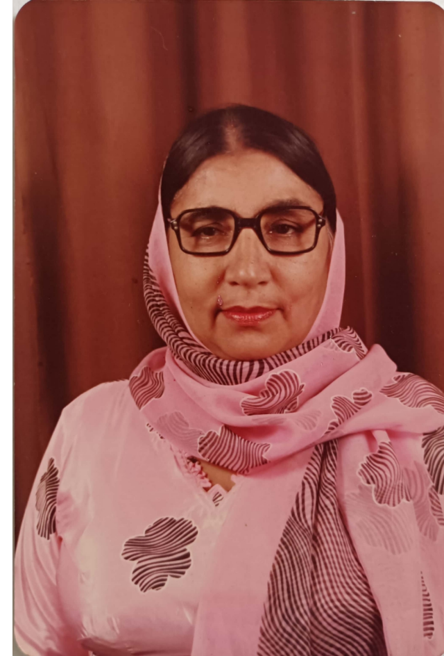
Scanned with CamScanner