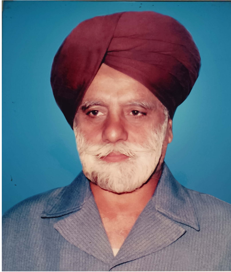
Scanned with CamScanner