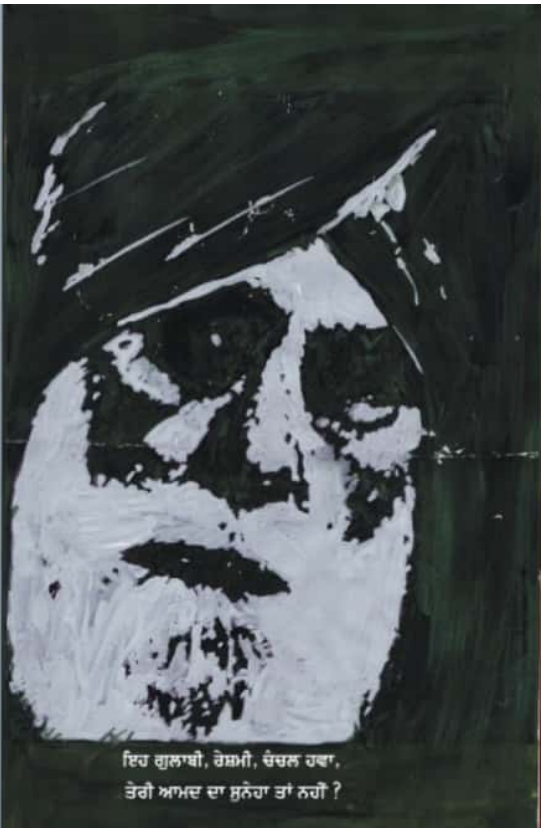
ਇਹ ਗੁਲਾਬੀ, ਰੋਸ਼ਮੀ, ਚੰਚਲ ਹਵਾ, ਤੇਰੀ ਅਮਦ ਦਾ ਸੁਨੇਹਾ ਤਾਂ ਨਹੀਂ ?